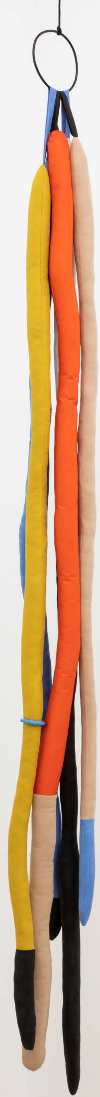
(2) all around , 2021