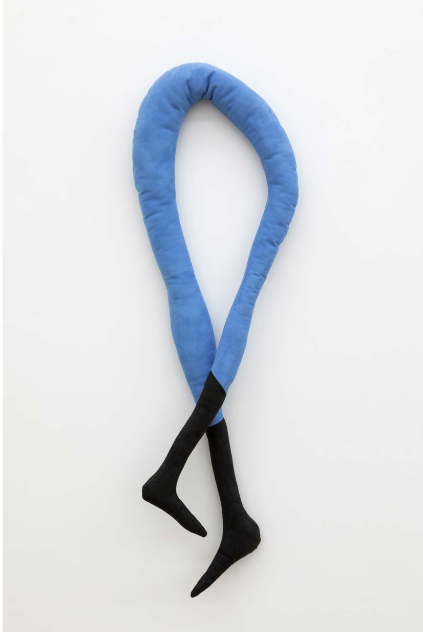
(7) HANGOVER # 3/8, 2020