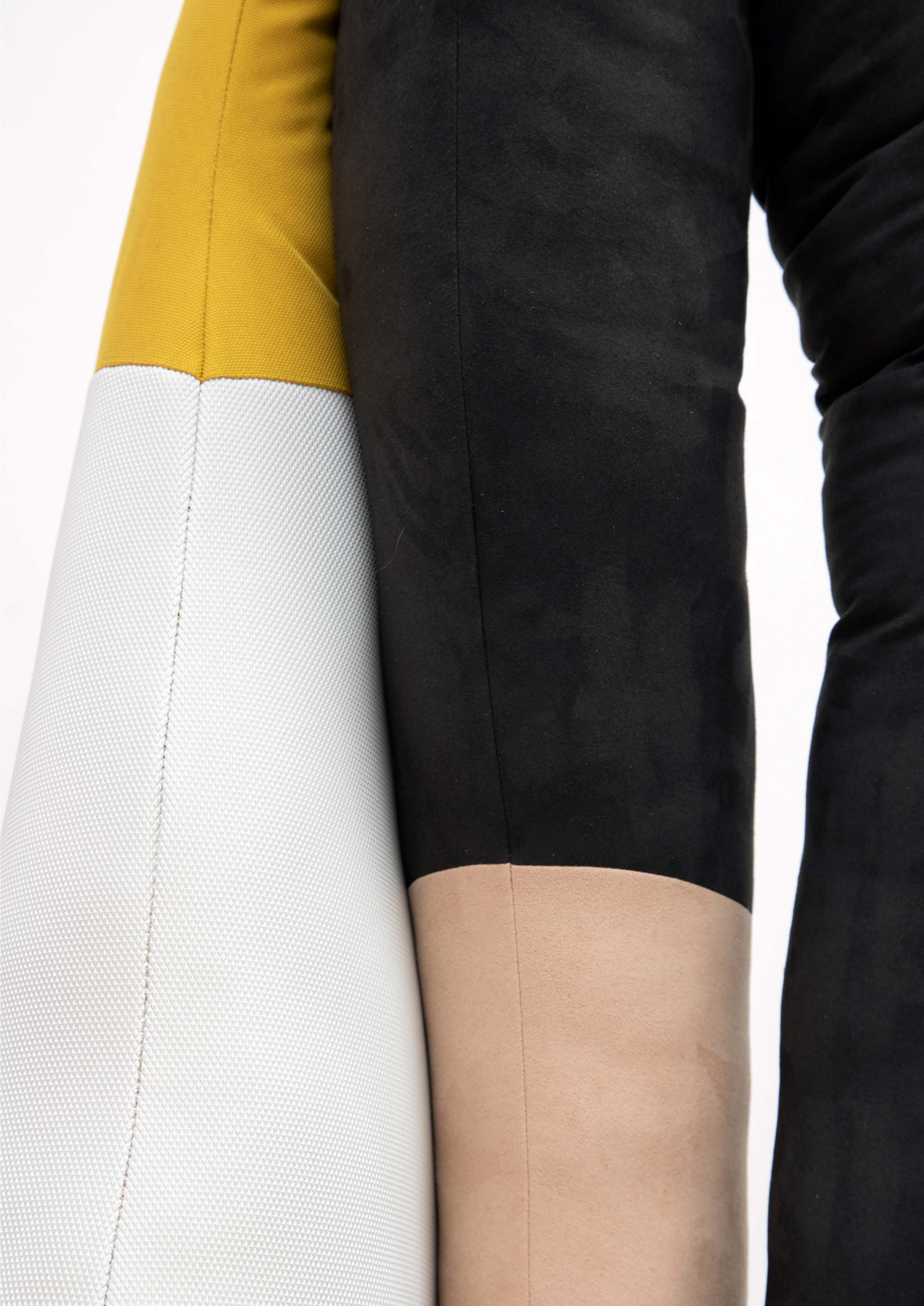
(4) Spiritual Bypass , 2021 Do you have everything you need? 2021, installation detail