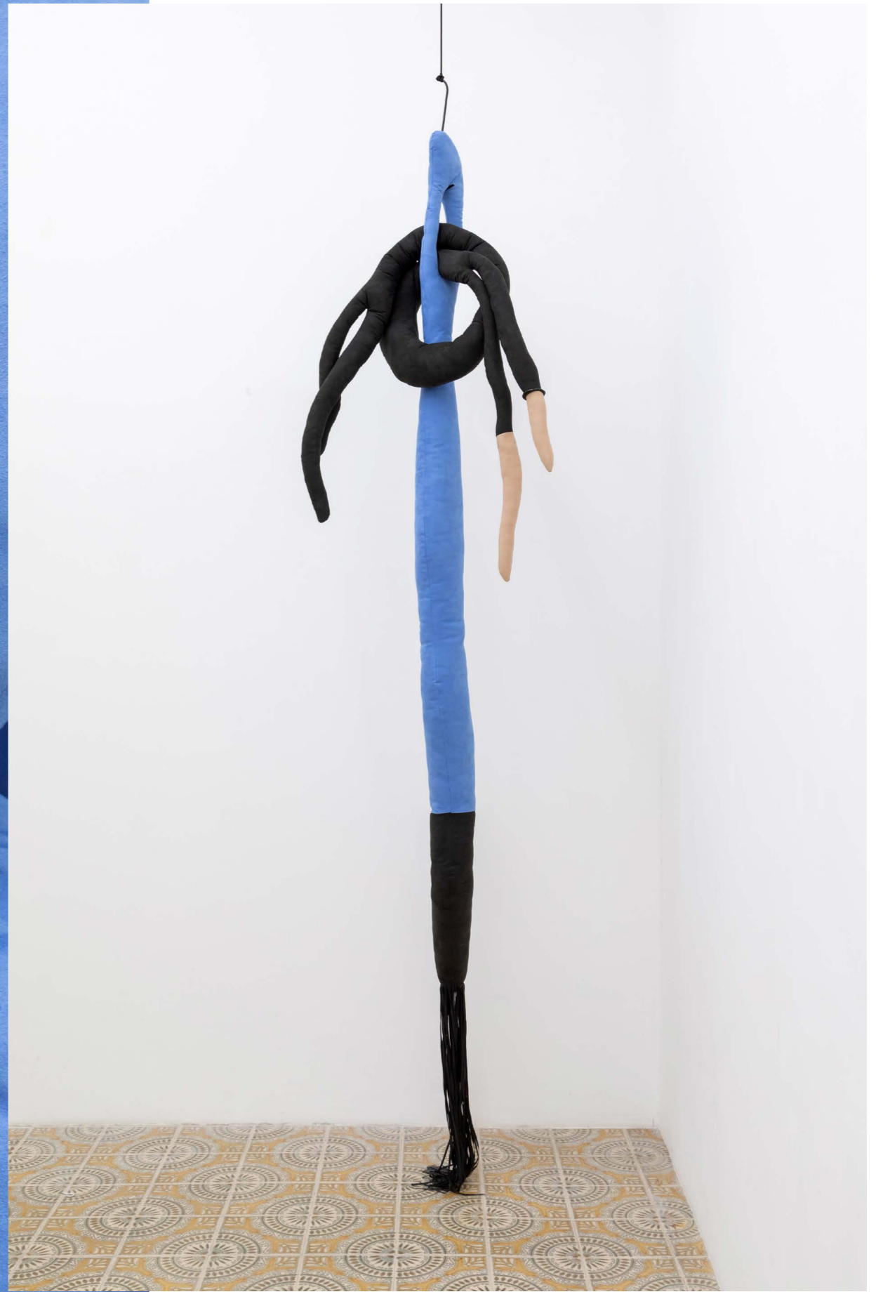
Let's take a moment to let that settle, 2021, installation detail (5) Hold on, I'll drop you off, 2021