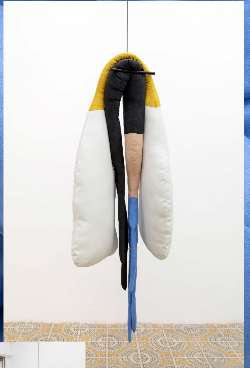
(3) Do you have everything you need? 2021