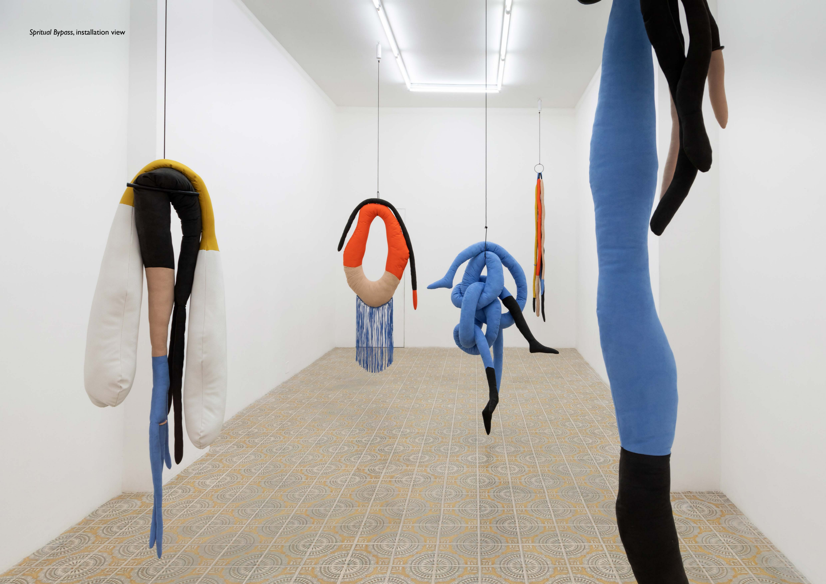
Spiritual Bypass, installation view