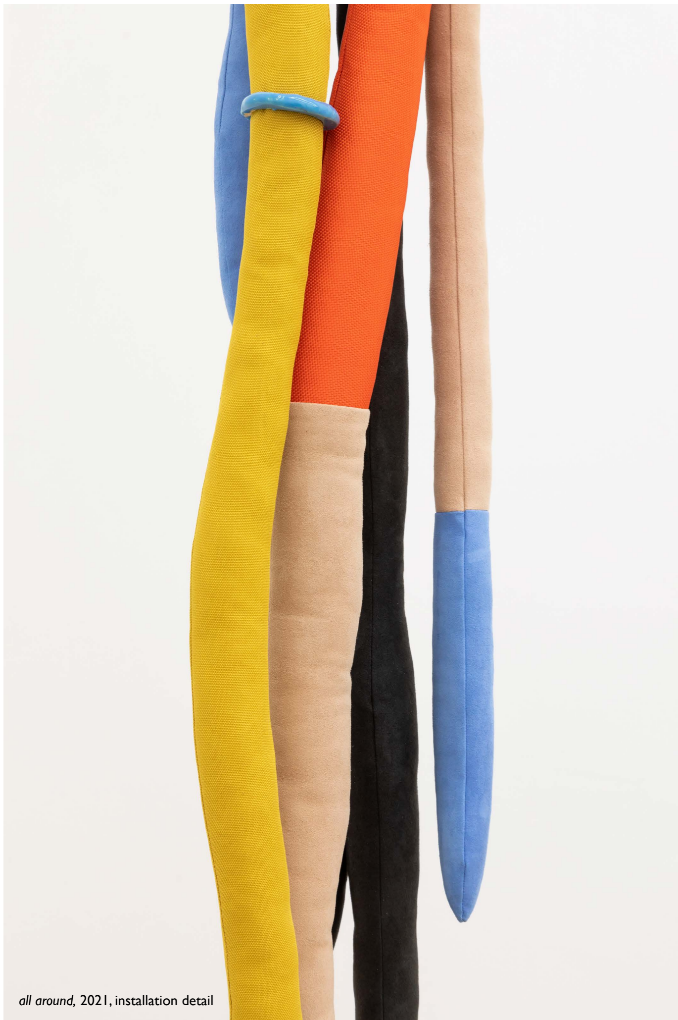
all around, 2021, installation detail