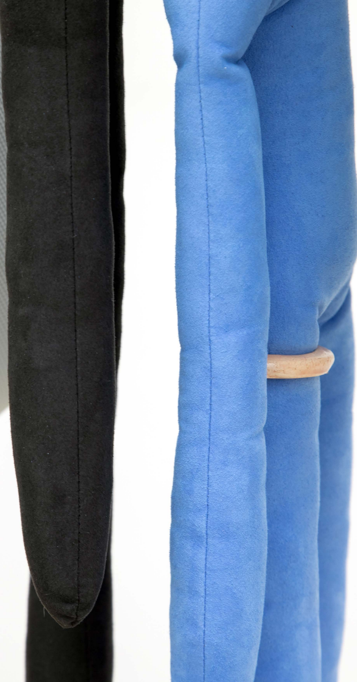
Do you have everything you need? 2021, installation detail