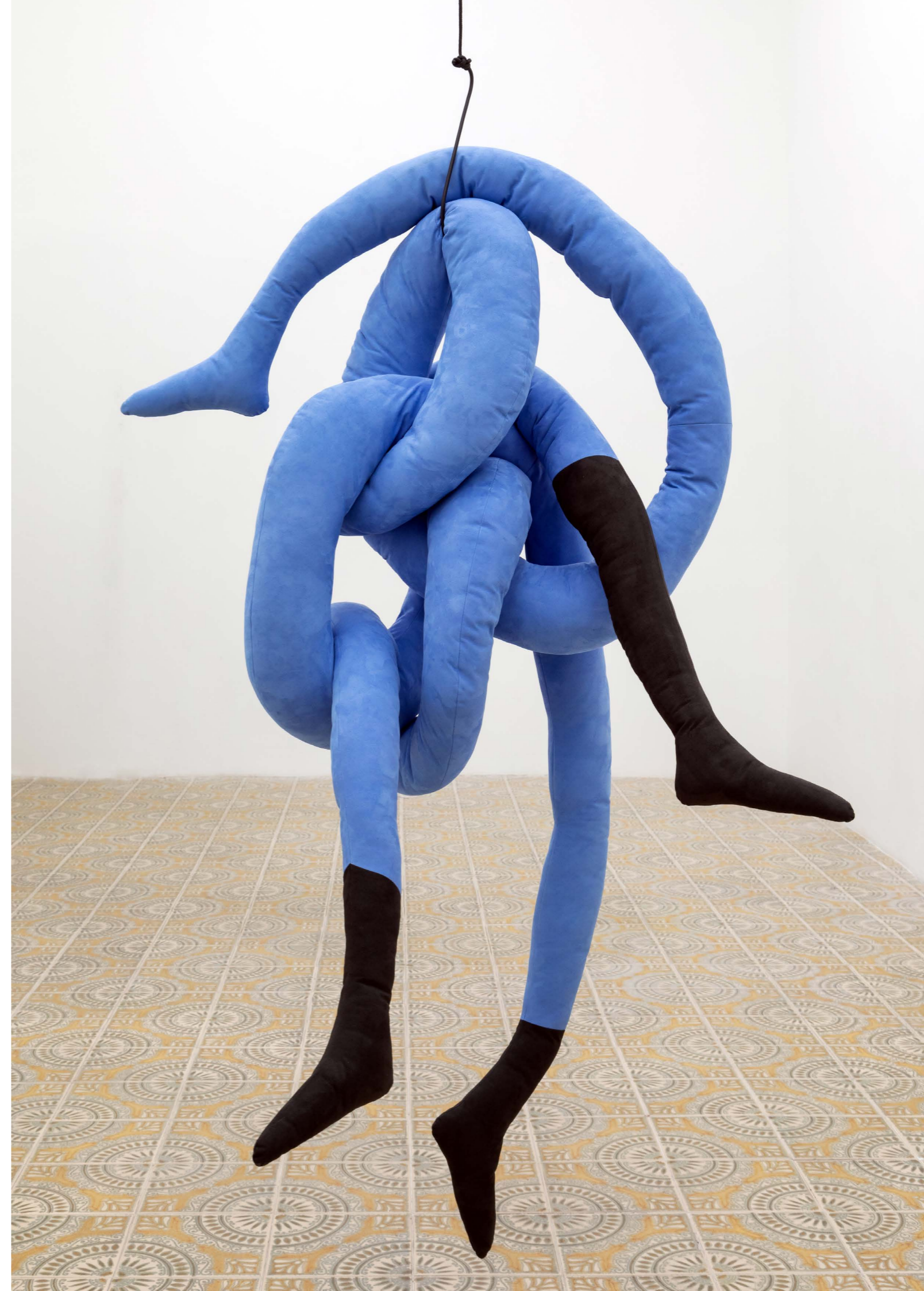
(1) Let's take a moment to let that settle , 2021