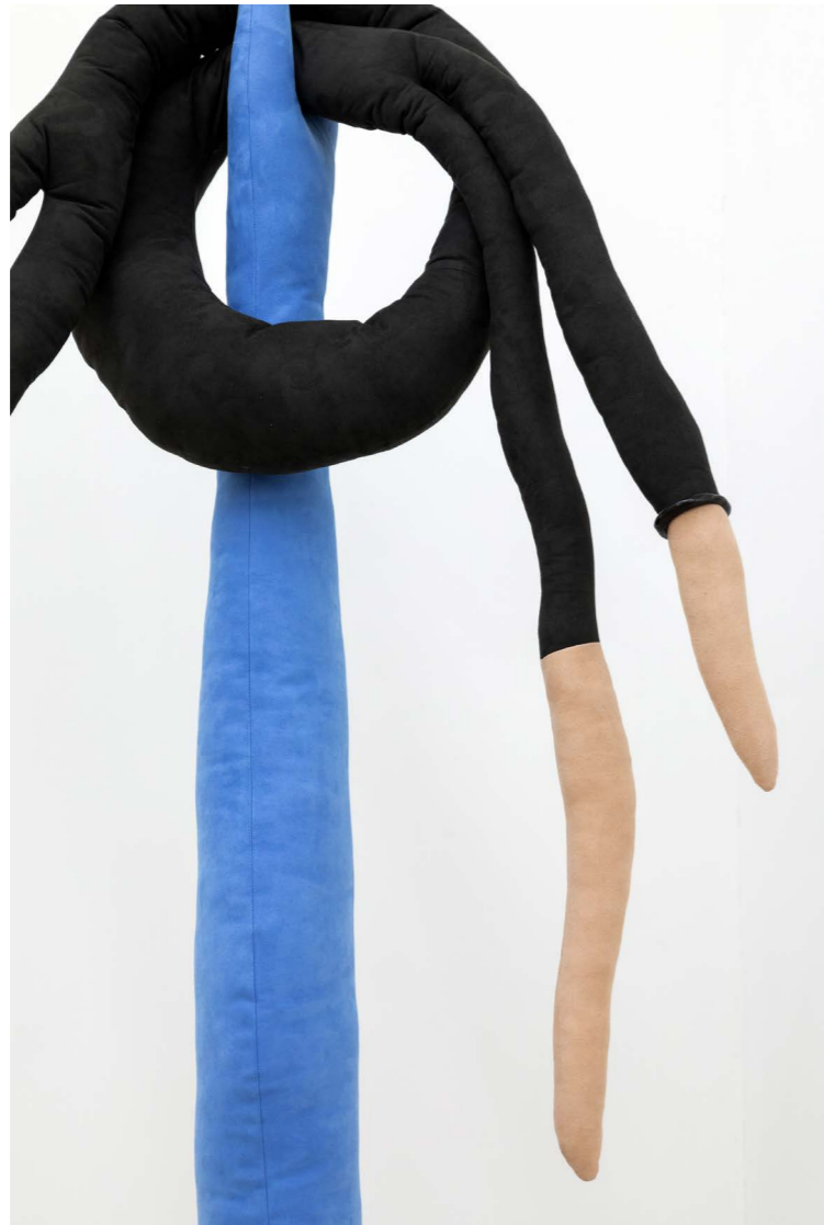
Let's take a moment to let that settle, 2021, installation detail all around, 2021, installation detail