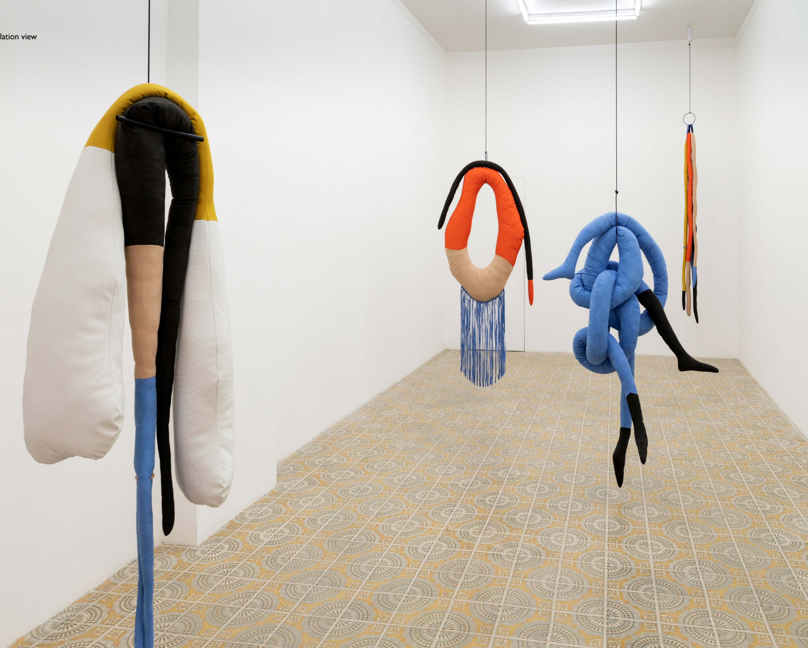
Spiritual Bypass, installation view